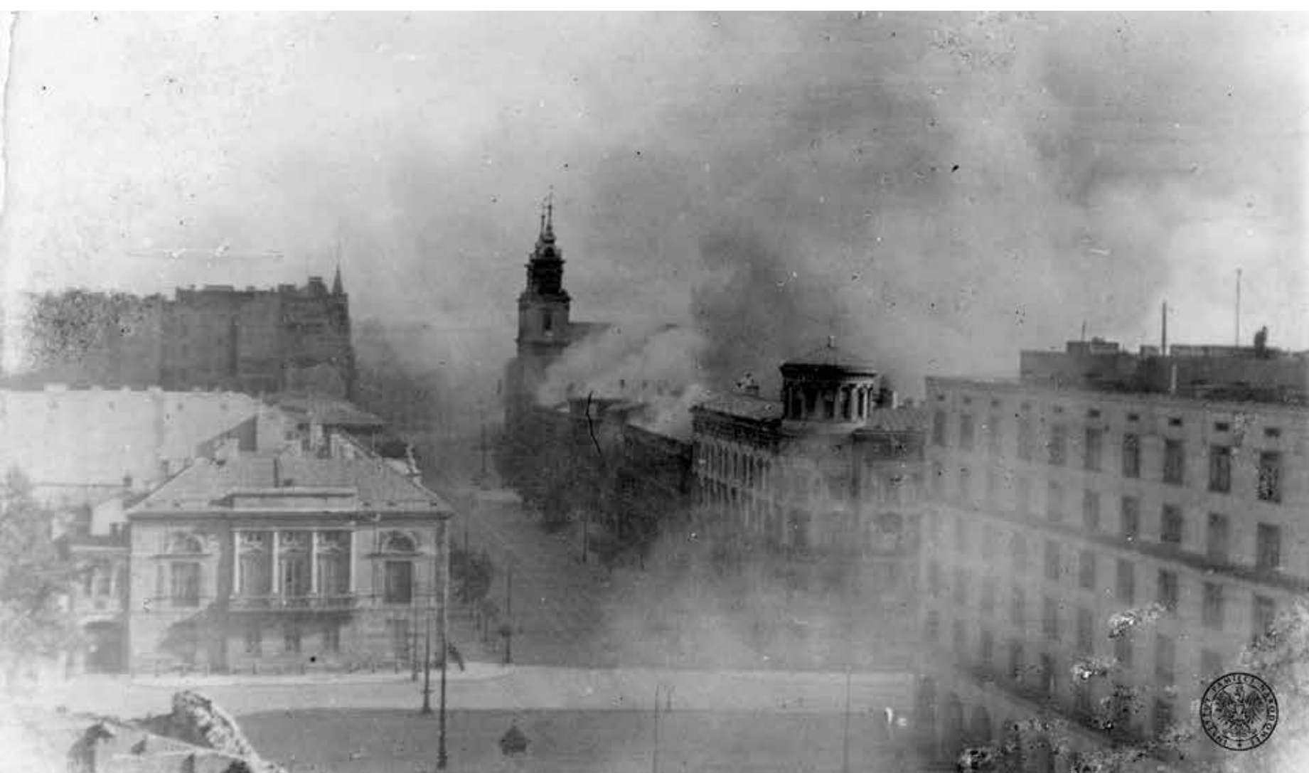
Płonące budynki przy ul. Krakowskie Przedmieście w Warszawie podczas oblężenia - widok ogólny z Hotelu Bristol w stronę ul. Nowy Świat.

Drugą co do wielkości kwotą pieniężną, która stanowiła dla Polski uszczerbek za sprawą Niemców, są straty materialne. Obejmują one zniszczenia budynków mieszkalnych i niemieszkalnych w miastach i na wsiach, obiektów zabytkowych, sakralnych i technicznych, np. na kolei (w tym mienie ruchome wykorzystywane w transporcie).