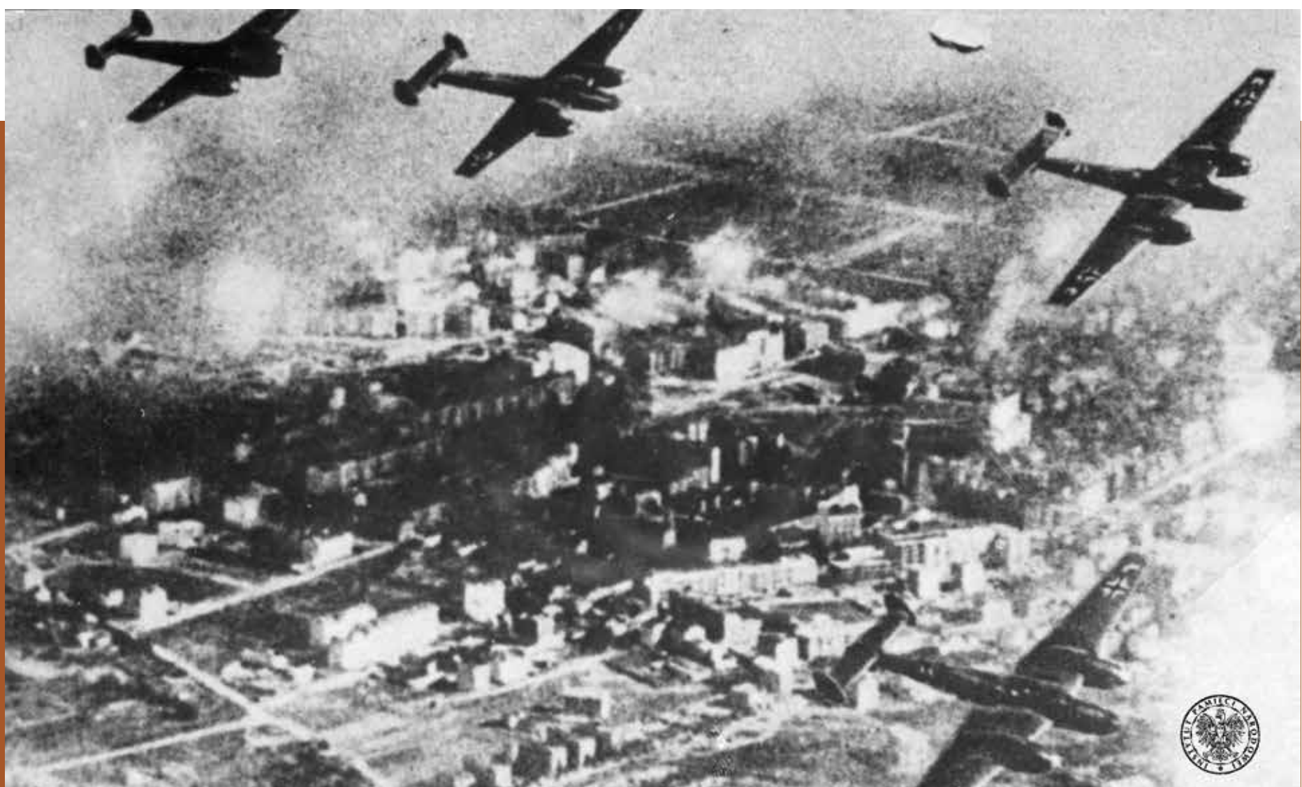
4 niemieckie ciężkie samoloty myśliwskie Messerschmitt Bf 110 podczas lotu nad Warszawą.

Również w dziedzinie bankowości i ubezpieczeń ponieśliśmy ogromne straty na skutek napaści Niemiec na nasz kraj. Przed wojną w Polsce sprawnie działała sieć instytucji kredytowo-oszczędnościowych. Ich aktywa wyceniano na dziesiątki miliardów przedwojennych złotych. Na terenach, które w trakcie wojny zostały wcielone do III Rzeszy całość majątku polskich banków oraz instytucji finansowych została skonfiskowana. Natomiast w Generalnym Gubernatorstwie Niemcy utrzymali część systemu, ale pozostawiono jedynie te organizacje, których działalność mogła służyć niemieckiej gospodarce wojennej. Podobnie przedstawiała się sytuacja instytucji ubezpieczeń społecz-