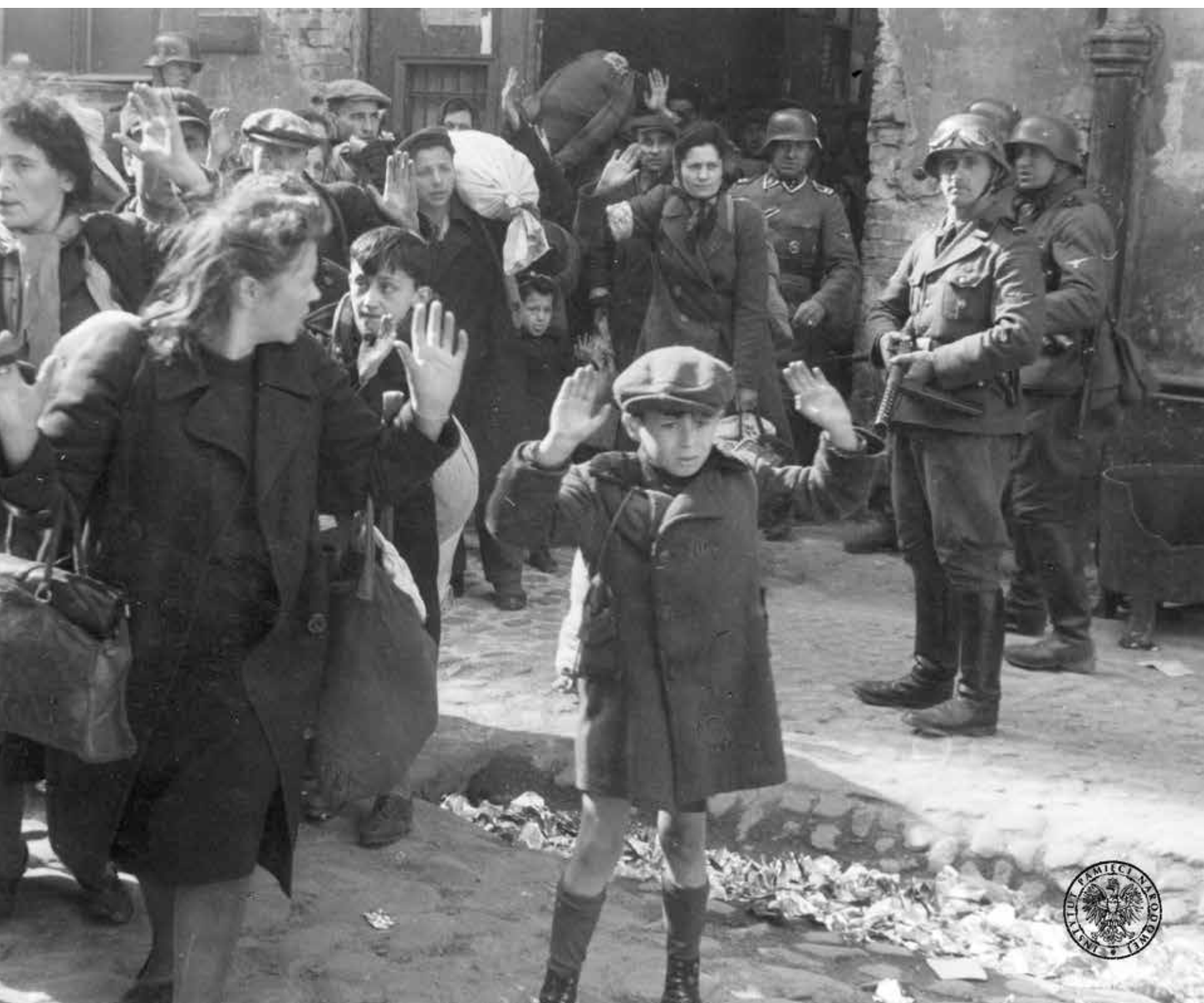
Zdjęcie z raportu SS-Brigadeführera Jürgena Stroopa dot. powstania w Getcie Warszawskim.

Dokument powstał dzięki pracy Parlamentarnego Zespołu ds. Oszacowania Wysokości Odszkodowań Należnych Polsce od Niemiec