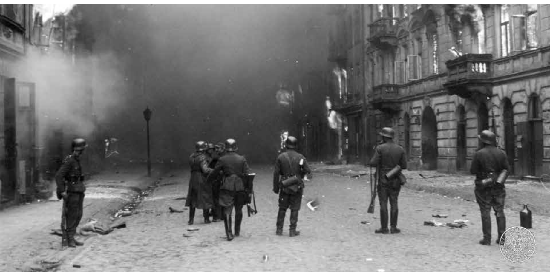
Zdjęcie z raportu SS-Brigadeführera Jürgena Stroopa. Grupa żołnierzy jednostek bojowych SS i policji.

Dlatego Polska ma pełne prawo domagać się zadośćuczynienia od Niemiec za straty poniesione w wyniku wojny i okupacji. Zwłaszcza że inne kraje w mniejszym stopniu dotknięte wojenną pożogą takie środki już otrzymały. Na przykład Grecja, która w 1960 roku dostała na mocy dwustronnej umowy 115 milionów marek zadośćuczynienia.