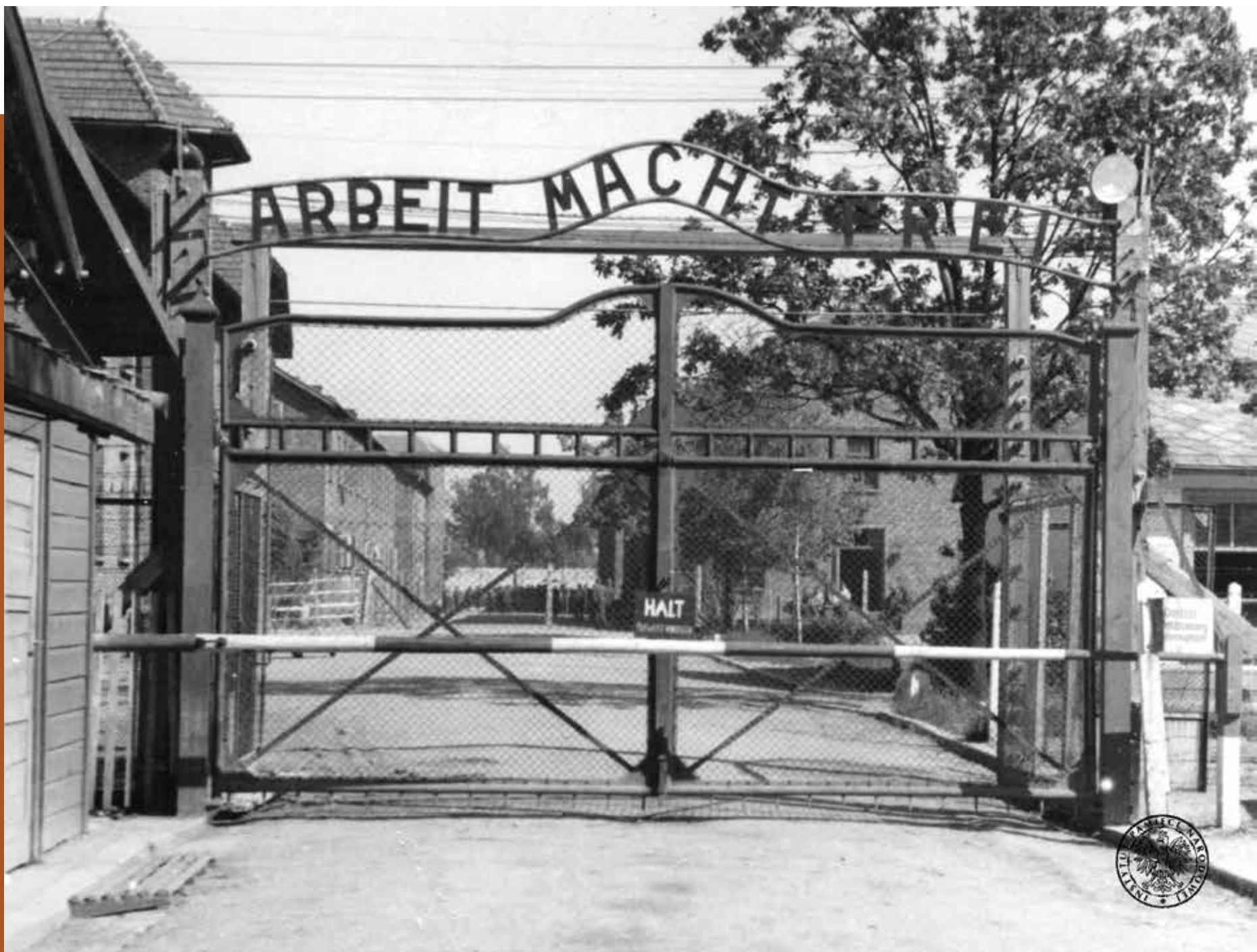
Zamknięta brama Obozu KL Auschwitz.

Niemcy szczególnie prześladowali polskich obywateli pochodzenia żydowskiego. Zaplanowali ich celową eksterminację w niemieckich obozach koncentracyjnych powstałych na terenie naszego kraju. Takie miejsca jak: Auschwitz czy Treblinka są do dziś symbolami niemieckiego bestialstwa.