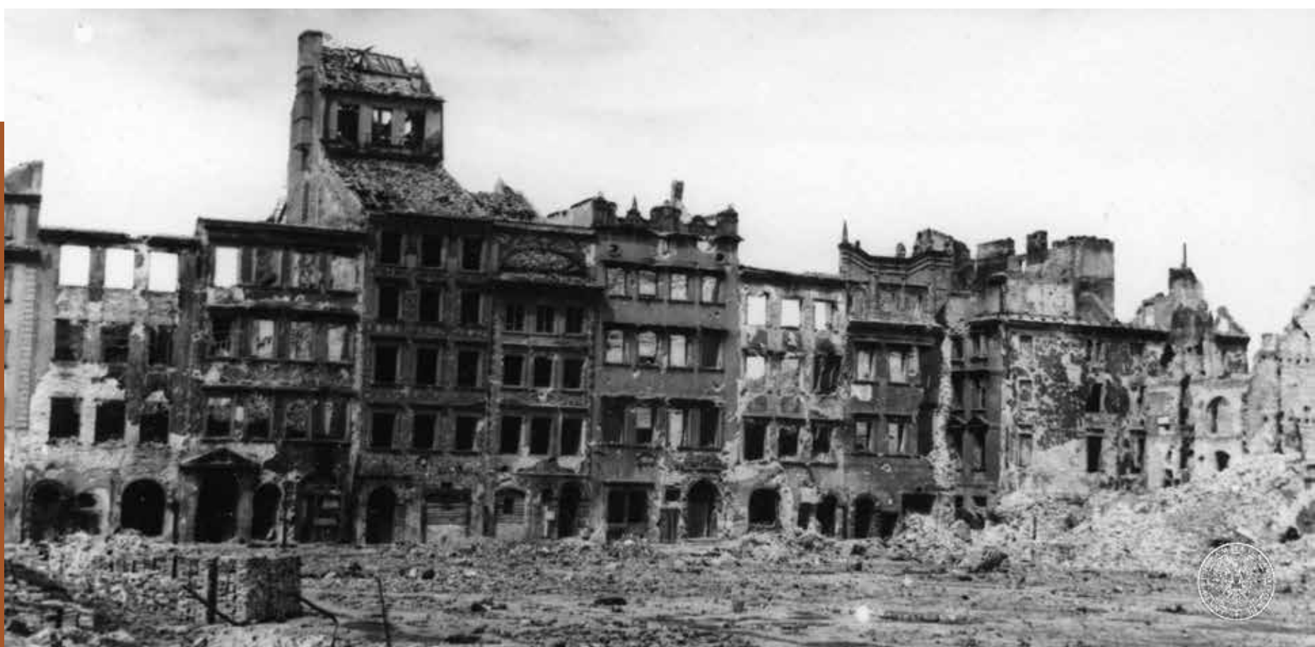
Ruiny Starego Miasta fragment rynku.

Warto podkreślić, że z dostępnych dokumentów wynika, że zabór mienia i sposób wykorzystania polskiej gospodarki na potrzeby III Rzeszy były przygotowywane już od połowy lat 30. XX w. Niemiecki wywiad oraz naukowcy gromadzili szczegółowe dane o wyposażeniu i potencjale produkcyjnym naszych przedsiębiorstw, zwłaszcza pod kątem zaprzęgnięcia ich w tryby niemieckiego przemysłu wojennego.