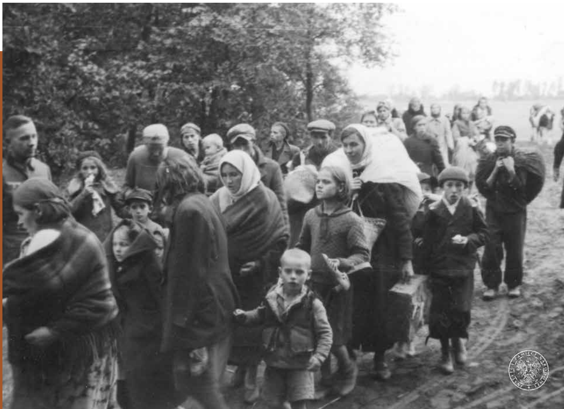
Liczna grupa cywilnych uchodźców.

za Szkody Wyrządzone w Trakcie II Wojny Światowej oraz grona niezależnych ekspertów. W sumie nad raportem przez 5 lat (2017–2022) pracowało 33 przedstawicieli polskiej nauki oraz sporządzono 10 zewnętrznych recenzji tego dokumentu.