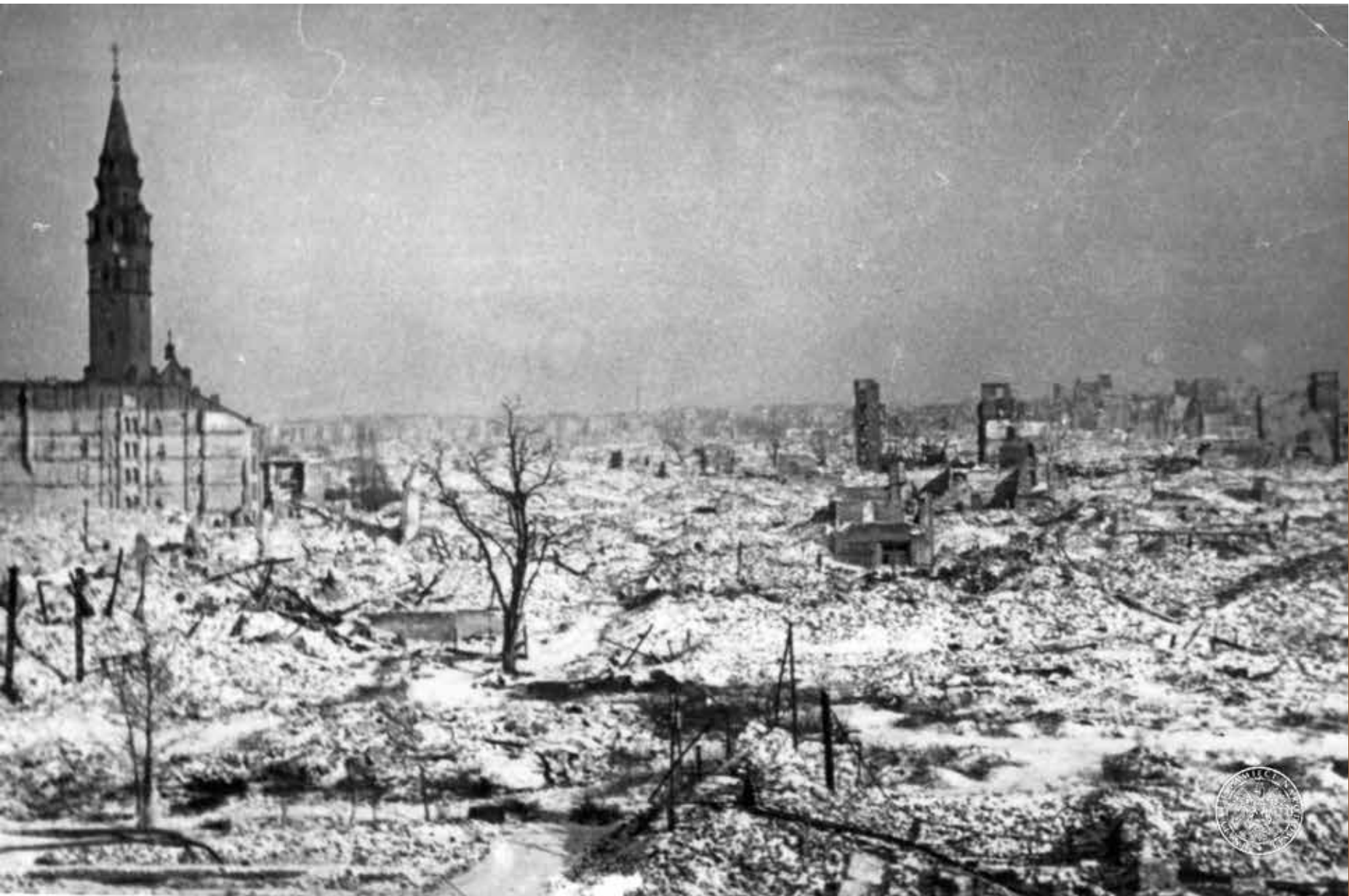
Kościół pw. Św. Augustyna (ul. Nowolipki 48/50) wśród ruin wyburzonej przez Niemców zabudowy byłego getta w rejonie skrzyżowania ulic Nowolipki i Smoczej oraz na południe od Nowolipki.

Ważnym elementem szkód, jakie państwo polskie poniosło na skutek niemieckiej napaści są straty Skarbu Państwa. Warto bowiem sobie uświadomić, że Niemcy przejęli funkcjonujący wcześniej